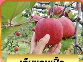
เก้บแอบเปิ้ล