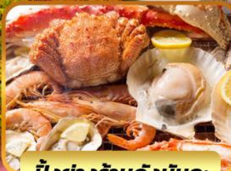
บ้่งย่างร้านดั่งน้ดะ