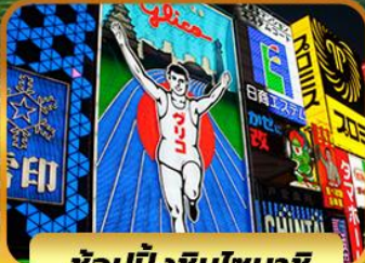
ช้อปปิ้งชินไซบาชิ