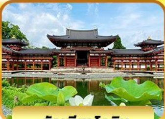
วัดเบียวโดอิน