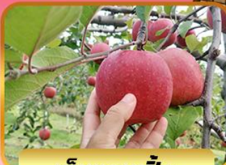
เก็บแอบเปิ้ล