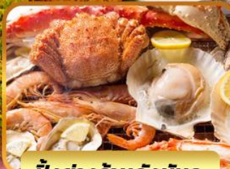
ปิ้งย่างร้านดังนั้นตะ