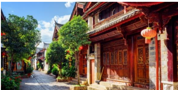
เมืองโบราณชู่เหอ คีเจียง

นำท่านเดินทางสู่ เมืองโบราณชู่เหอ หรือที่ภาษาชาวนาซีเรียกว่า “เส้าอู” หมายความว่า หมู่บ้านที่อยู่ด้านล่างภูเขาสูง อดีตที่นี่เป็นทางผ่านของเส้นทางสายชาและม้า (茶马古道) ซึ่งเป็นเส้นทางการค้าโบราณที่สำคัญเช่นเดียวกับเส้นทางสายไหม ปัจจุบันชู่เหอ เป็นเมืองโบราณเล็กๆแห่งหนึ่ง และยังจำหน่ายสินค้าพื้นเมือง เป็นแหล่งช้อปปิ้ง ร้านอาหาร และปลูกดอกไม้ในลานเล็กๆ บริเวณสวนใหญ่จะปลูกต้นไม้ใหญ่ ทั้ง 4 ฤดูกาล จะได้กลิ่นหอมโชยของดอกไม้ เนื่องจากสิ่งแวดล้อมของที่นี่มีความเงียบสงบและเรียบง่าย