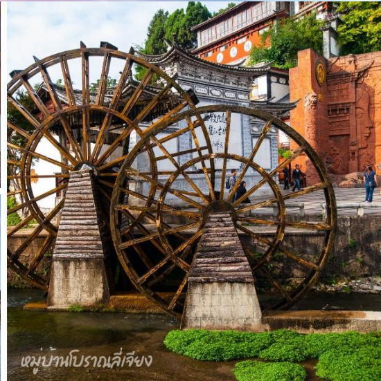
เขม่าน้ำโบราณลี่เจียง

ค่ำ บริการอาหารค่ำ ณ ภัตตาคาร ลิ้มรสอาหารเมนูพิเศษ...สุกี้ปลาแซลมอน