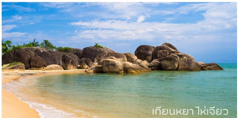
เทียนยาไห่เจียว