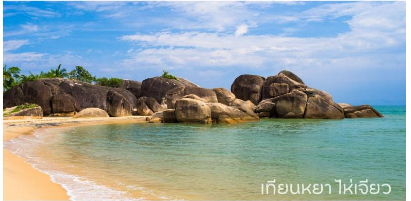
เทียนหย่าไห่เจียว