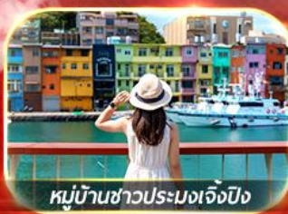
หมู่บ้านชาวประมงเจิ้งปิง