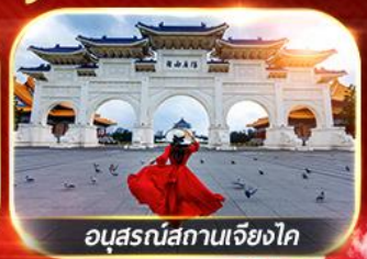
อนุสรณ์สถานเจียงไค

อาลีซาน นั่งรถไฟสายโรแมนติก ชมเมืองโบราณจิวเฟิ่น ล่องเรือชมทะเลสาบสุริยันจันทรา เช็กอินหมู่บ้านชาวประมงเจิ้งปิง