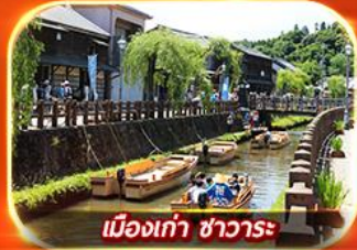
เมืองเก่า ซาวาระ