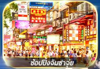
ซุปปิ้งจิมซาจู้

เต็มอิ่มทั้ง ไหว้พระ-ขอพร และ ซุปปิ้งแบบจัดเต็ม