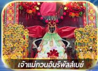
เจ้าแม่กวนอิมรีพลัสเบย์