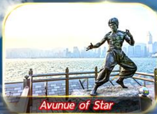
Avunue of Star