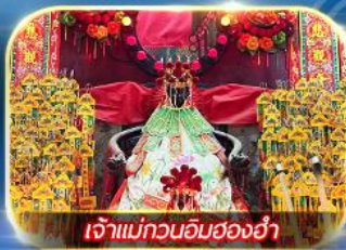
เจ้าแม่กวนอิมของฮำ