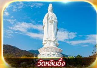
วัดหลันอิ่ง