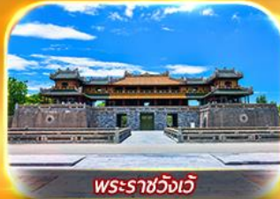
พระราชวังเว้