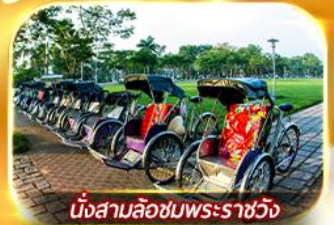
นั่งสามล้อชมพระราชวัง

สัมผัสความสวยงามหมู่บ้านสไตล์ฝรั่งเศสที่บานาฮิลล์ วัดเทียนมู่ พระราชวังเว้ สัมผัสเมืองโบราณฮอยอัน ล่องเรือกระดัง