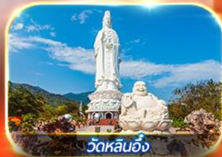
วัดหลินอิ่ง