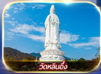
วัดหลินอิ่ง