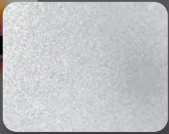
กัลวาไนซ์