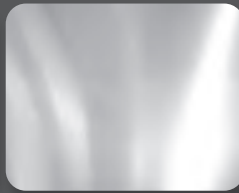
อะลูมิเนียม