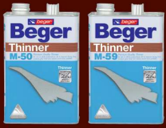
ทินเนอร์ เบเยอร์ M-50 ทินเนอร์ เบเยอร์ M-59 ลดรอยแปรง เหมาะกับฟิล์มสี ชนิดด้าน และชนิดกึ่งมัน