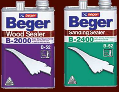
เบเยอร์ B-2000 เบเยอร์ B-2400