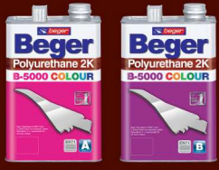
เบเยอร์ โพลียูรีเทน B-5000 คัลเลอร์