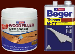
เบเยอร์ วู้ด ฟิลเลอร์ ทินเนอร์ M-77