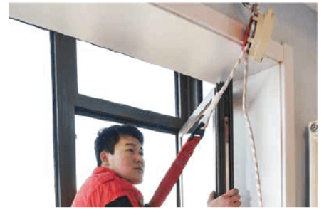
6. โยนปลายอีกด้านของสลิงลงไป ที่พื้น และปล่อยตัวลงมา