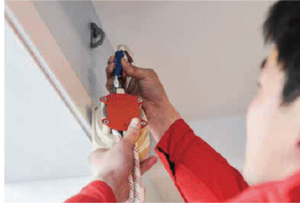
2. เชื่อมต่อ Myfly เข้ากับตะขอ