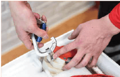
4. ต่อสายสลิงเข้ากับ Myfly