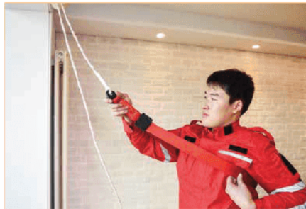
5. นำสลิงโพลีเอสเตอร์ไปคล้องตัว และนำไปไว้ใต้แขนของคุณ