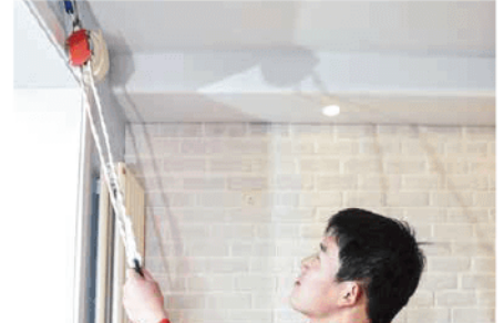
3. เชื่อมต่อสลิงโพลีเอสเตอร์ เข้ากับจุดยึด