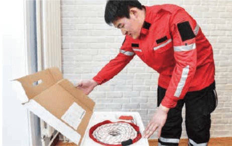
1. นำอุปกรณ์ออกมาและตรวจสอบ