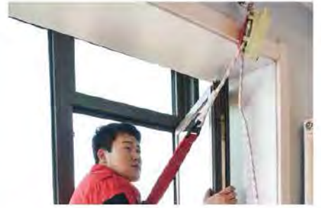
6. โยนปลายอีกด้านของสลิงลงไป ที่พื้น และปล่อยตัวลงมาที่พื้น