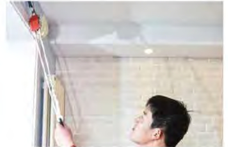
3. เชื่อมต่อสลิงสลิงไฟลอสเตอร์เข้ากับจุดยึด