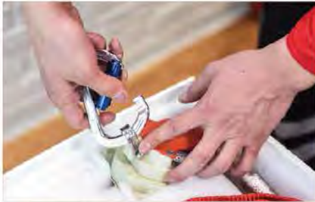
4. ต่อสายสลิงเข้ากับ Myfly