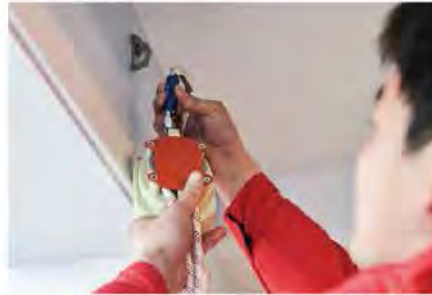
2. เชื่อมต่อ Myfly เข้ากับตะขอ