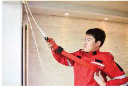
5. นำสลิงสลิงไฟลอสเตอร์ไปไว้ คลังตัวและนำไปไว้ใต้แขนของคุณ