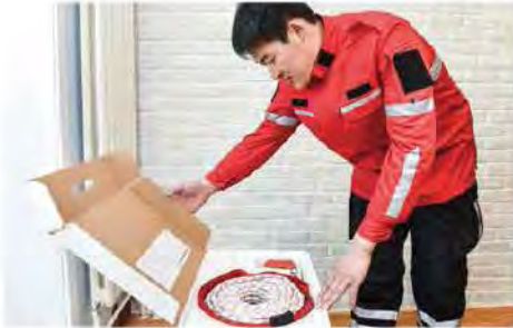
1. นำอุปกรณ์ออกมาและตรวจสอบ