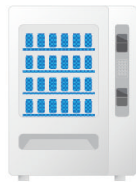
บนช่องวางสินค้า