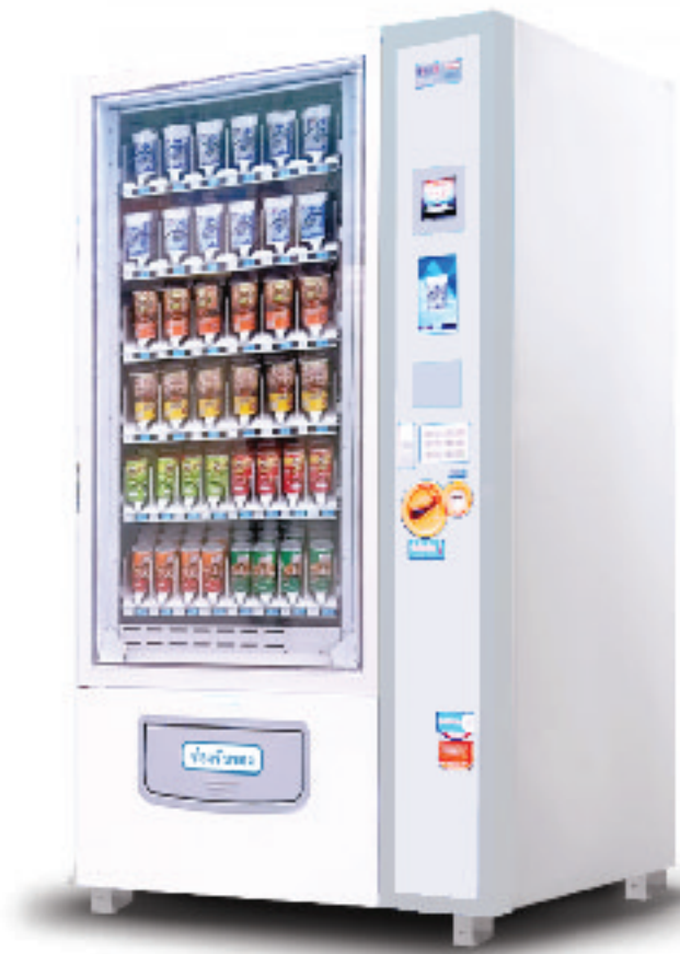
รุ่น C-EA โชว์สินค้าได้ 36 ชนิด ประเภท: กระจ่าง/ขวด/กล่องอัตโนมัติ

ระบบไฟฟ้า : 220V บรรจุสินค้า : 144 ชิ้น ขนาด : 112 x 77 x 193 cm มีระบบความเย็น มีจอ LED 22"