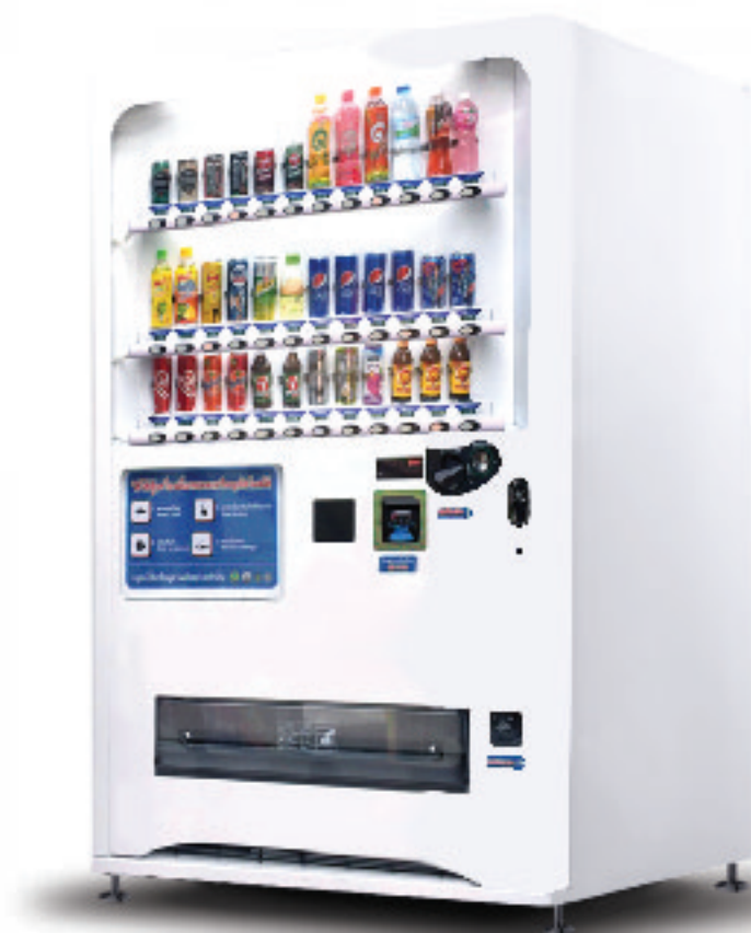
รุ่น J-B30 โขว์สินค้าได้ 30 ชนิด ประเภท: กระจ่าง/ขวด/กล่องอัตโนมัติ

ระบบไฟฟ้า : 220V บรรจุสินค้า : 410-490 หน่วย ขนาด : 90 x 70 x 185 cm มีระบบความเย็น : 0-10 °C ฿ รับ-ทอนเหรียญ : 1, 2, 5, 10 ■ รับธนบัตร : 20, 50, 100 *ติดเครื่องรับธนบัตร เพิ่ม 20,000 บาท