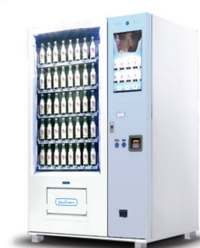
C-CD900-9C โขว์สินค้าได้ 24 ชนิด ประเภท: กระจ่าง/ขวด/กล่องอัตโนมัติ

ระบบไฟฟ้า : 220V บรรจุสินค้า : 570 หน่วย ขนาด : 80 x 80 x 185 cm มีระบบความเย็น : 0-10 °C ฿ รับ-ทอนเหรียญ : 1, 2, 5, 10 ■ รับธนบัตร : 20, 50, 100 *ติดเครื่องรับธนบัตร เพิ่ม 20,000 บาท