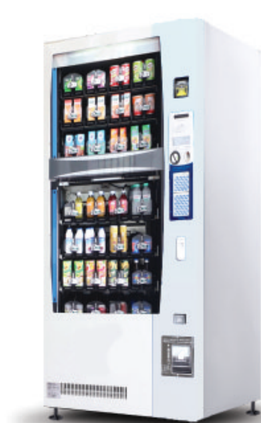
รุ่น J-D28 โขว์สินค้าได้ 28 ชนิด ประเภท: กระจ่าง/ขวด/กล่องอัตโนมัติ

ระบบไฟฟ้า : 220V บรรจุสินค้า : 740-890 ชิ้น ขนาด : 135 x 80 x 185 cm มีระบบความเย็น : 0-10 °C ฿ รับ-ทอนเหรียญ : 1, 2, 5, 10 ■ รับธนบัตร : 20, 50, 100 *ติดเครื่องรับธนบัตร เพิ่ม 20,000 บาท