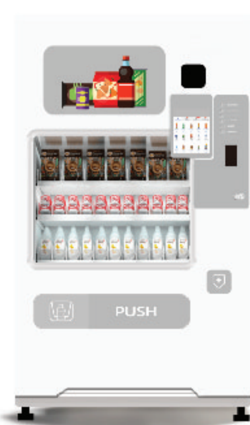
รุ่น CP23 ตู้เครื่องดื่มกระจ่าง/ขวด ระบบไฟฟ้า : 220V บรรจุสินค้า : 425 ชิ้น/ ขวด 12 ช่อง/ กระจ่าง 11 ช่อง ขนาด : 107w x 80D x 183H cm มีระบบความเย็น : 5-26 °C