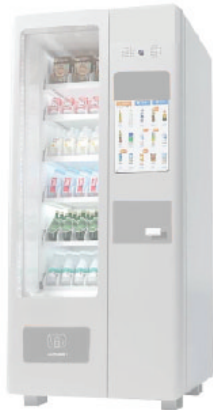
รุ่น 2105 ตู้เครื่องดื่มกระจ่าง/ ขวด/ กล่อง/ ช่อง/ ถ้วย ระบบไฟฟ้า : 220V บรรจุสินค้า : 150 ชิ้น/ 30 ช่อง ขนาด : 89w x 96D x 182H cm มีระบบความเย็น : 5-26 °C