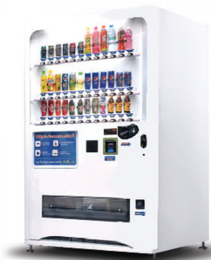
รุ่น J-D42 โขว์สินค้าได้ 42 ชนิด ประเภท: กระจ่าง/ขวด/กล่องอัตโนมัติ

ระบบไฟฟ้า : 220V บรรจุสินค้า : 650-780 ชิ้น ขนาด : 115 x 80 x 185 cm มีระบบความเย็น : 0-10 °C ฿ รับ-ทอนเหรียญ : 1, 2, 5, 10 ■ รับธนบัตร : 20, 50, 100 *ติดเครื่องรับธนบัตร เพิ่ม 20,000 บาท