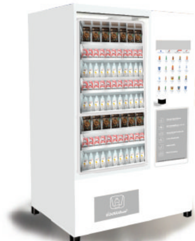
รุ่น 2708 ตู้เครื่องดื่มกระจ่าง /ขวด/กล่อง/ช่อง/ถ้วย ระบบไฟฟ้า : 220V บรรจุสินค้า : 260 ชิ้น/ 48 ช่อง ขนาด : 124w x 90D x 189H cm มีระบบความเย็น : 5-26 °C