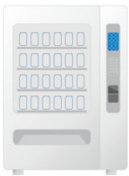
บนหน้าจอ LED

สื่อประชาสัมพันธ์ทางการตลาดหลากหลายรูปแบบ ที่มีประสิทธิภาพและเข้าถึงกลุ่มเป้าหมายได้ง่าย ลงทุนน้อย คนเห็นมาก