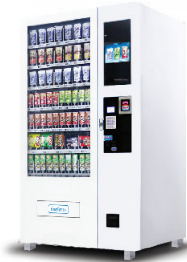
C-BS770-10C โชว์สินค้าได้ 23 ชนิด ประเภท: กระจ่าง/ขวด/กล่องอัตโนมัติ

ระบบไฟฟ้า : 220V บรรจุสินค้า : 190-250 ชิ้น ขนาด : 112 x 77 x 193 cm ไม่มีระบบความเย็น มีจอ LED 22"