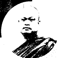
พระราชวัชรสารบัณฑิต, ศษ.ดร. รองอธิการบดี ฝ่ายวางแผนและพัฒนา มหาวิทยาลัยมหาจุฬาลงกรณราชวิทยาลัย