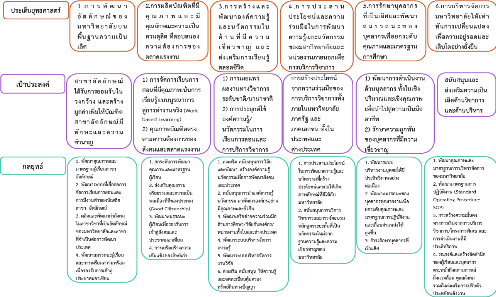
ภาพที่ 2 แผนกลยุทธ์ 4 ปี พ.ศ. 2557 – 2560 มหาวิทยาลัยสวนดุสิต

ปรัชญา : มหาวิทยาลัยที่สามารถสร้างความเข้มแข็งในการอยู่รอดได้อย่างยั่งยืน (Sustainable Survivability)