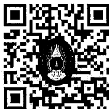
QR code สำหรับลงทะเบียน

ผู้ที่มีความประสงค์ร่วมนำเสนอผลงานวิจัยสามารถลงทะเบียนสมัครได้ที่ https://research.kpru.ac.th/std-conference๕/ หรือทาง QR code ที่อยู่ด้านล่างนี้ โดยชำระค่าลงทะเบียนหลังการส่งบทความเข้าระบบ เพื่อเป็นการยืนยันการส่งบทความให้พิจารณาเข้าร่วมการประชุมวิชาการ