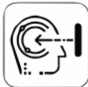
Proactive Facial Recognition