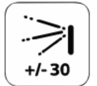
Wide Pose Angle Acceptance

FacePro-X5 เป็นเครื่องบันทึกเวลาเข้า-ออกงานแบบเรียลไทม์และไร้การสัมผัส ด้วยอัลกอริทึมล้ำสุดและเทคโนโลยีการจดจำใบหน้าภายใต้แสงปกติ โดยเครื่องนี้จะสามารถทำงานโดยอัตโนมัติเมื่อตรวจพบใบหน้าของบุคคล ในระยะ 30-50 ซม. อีกทั้งยังทำงานร่วมกับอัลกอริทึม cutting-edge 3D Neuron เพื่อรองรับการสแกนลายนิ้วมือ และนอกจากนี้ยังสามารถรองรับการสแกนบัตรได้อีกหลากหลายรูปแบบ