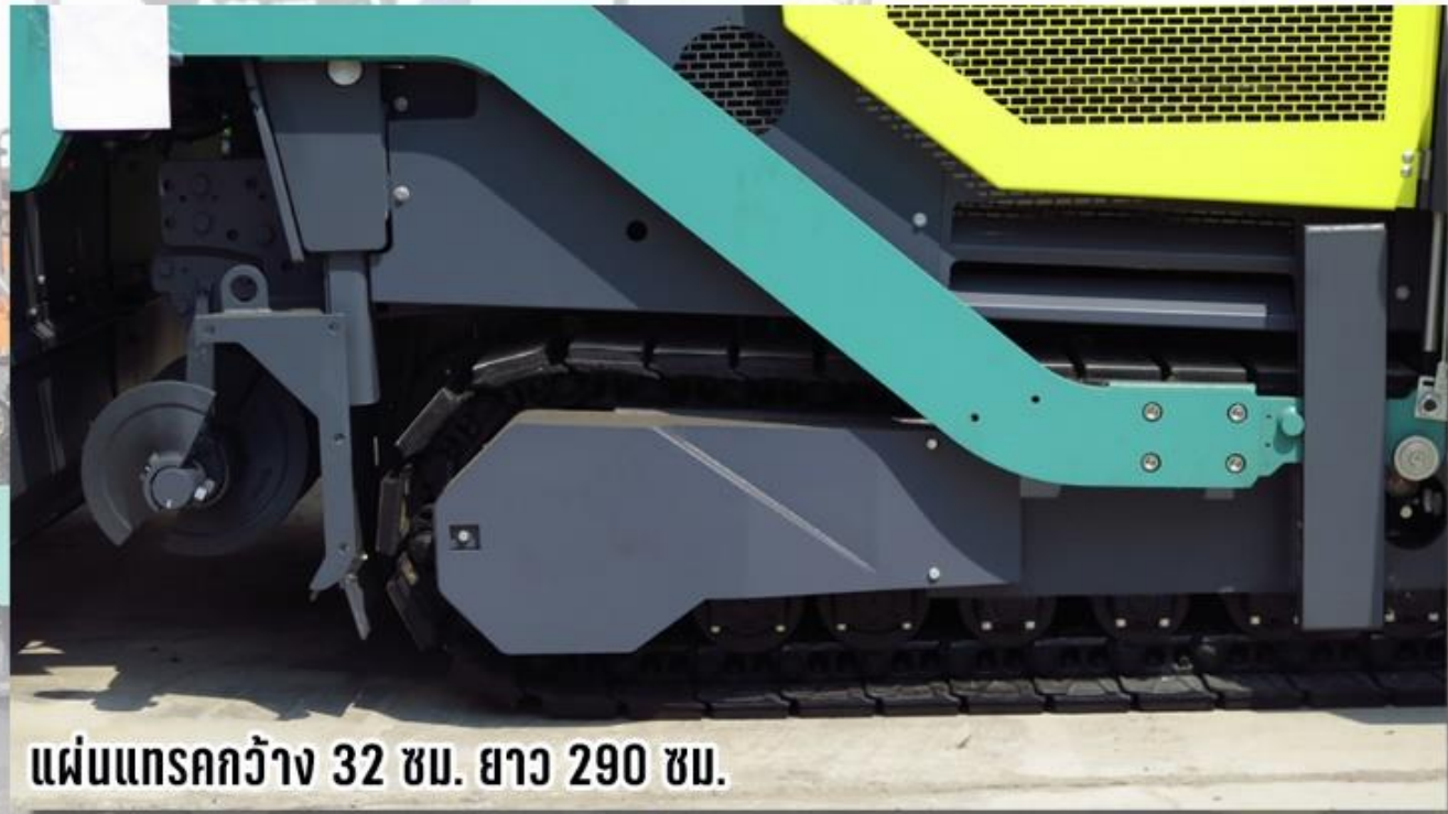
แผ่นแทรกกว้าง 32 ซม. ยาว 290 ซม.

ระบบขับเคลื่อนแทร็คคู่ คอนโทรลมอเตอร์ตัวเดิน ที่ใช้ในการเคลื่อนที่ สามารถปรับความเร็วของมอเตอร์ตัวเดินได้ถึง 2 ข้าง ให้ช้าเร็วต่างกันได้