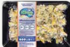
Frozen Steamed Clam Meat 200 g.