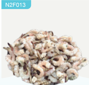
Frozen Peeled Vannamee Shrimp (40 shrimps/kg.) 1,000 g.