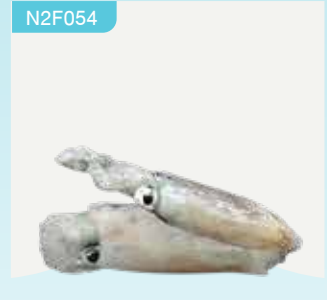
Frozen Jumbo Bigfin Reef Squid (1 squid) 700-850 g.