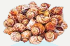
Frozen Sweet Clam (30-40 clams/kg.) 1,000 g.