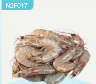
Frozen Banana Shrimp (20 prawns/kg.) 500 g.