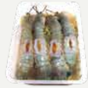
Frozen egg Crayfish Marinated In Fish Sauce (25 crayfish/kg.) 300 g.