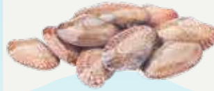
Frozen Clam (50-70 clams/kg.) 1,000 g.