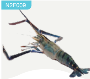
Frozen Scampi (3 scampies/kg.) 3 scampies