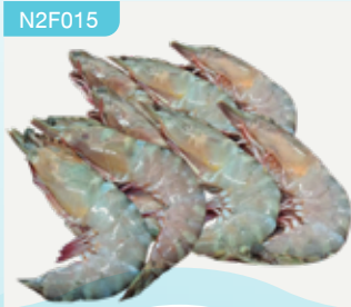
Frozen White Tiger Prawn (10-12 Prawns/kg.) 500 g.