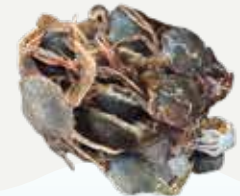
Frozen Katoi Crab 250 g.