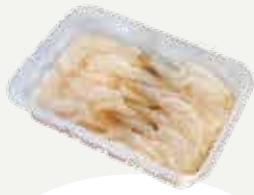
Frozen Shrimp Marinated In Fish Sauce (50 shrimps/kg.) 10-12 shrimps