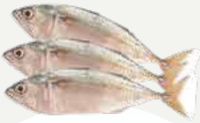
Frozen Mackerel (12 fish/kg.) 500 g.