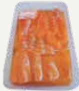
Frozen Salmon Marinated In Soy Sauce 300 g.