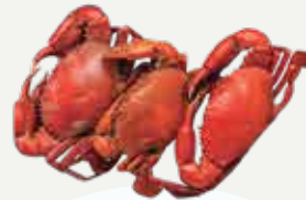
Frozen Steamed Black Crab (3 crabs/kg.) 700-850 g.