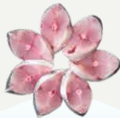
Frozen King Mackerel Steak 500 g.