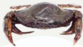
Frozen Soft-Shell Crab (4-5 crabs/kg.) 680-750 g.