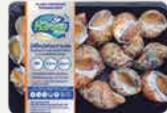
Frozen Sweet Scallop 300 g.