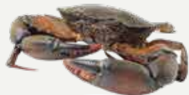
Frozen Black Crab (2-3 crabs/kg.) 900-1,000 g.