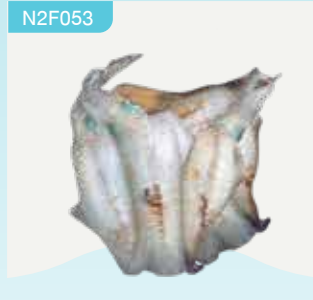
Frozen Bigfin Reef Squid (3 squids/kg.) 1,000 g.