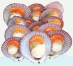
Frozen Scallop With One Side Shell (27-30 scallops/kg.) 500 g.