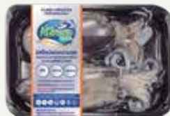
Frozen Bigfin reef squid (size 4 squid/kg.) 500 g.