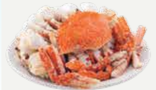
Frozen Peeled Steamed Blue crab (5-6 crabs/kg.) 500 g.