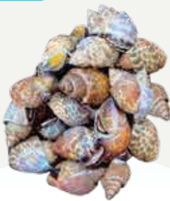
Frozen Sweet Clam (50-70 clams/kg.) 1,000 g.