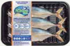
Frozen Mackerel (Size 12fish/kg.) 3 fish