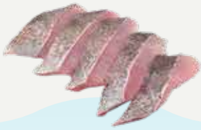
Frozen Sliced Hybrid Grouper 1,000 g.