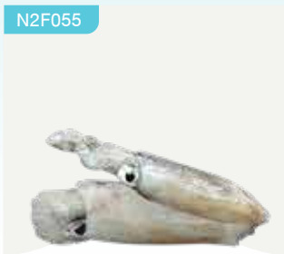
Frozen Jumbo Bigfin Reef Squid (1 squid) 550-680 g.