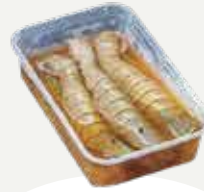
Frozen Crayfish Marinated In Fish Sauce (25 crayfish/kg.) 300 g.