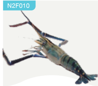
Frozen Scampi (4 scampies/kg.) 3 scampies