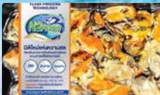
อาหารทะเล Skin Pack Product