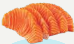
Frozen Salmon Sashimi 160 g.