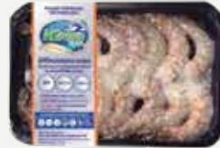
Frozen Peeled White Tiger Prawn (size 40 prawns/kg.) 120 g.