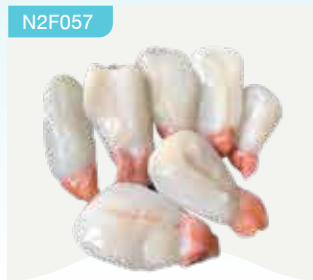
Frozen Cuttlefish Egg 300 g.