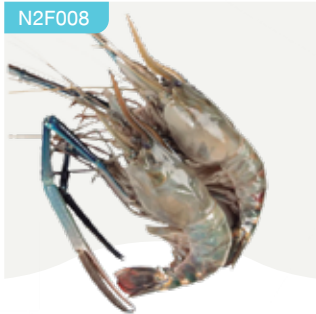
Frozen Scampi (2 scampies/kg.) 2 scampies