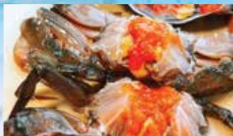
อาหารทะเล ดองน้ำปลาแช่แข็ง