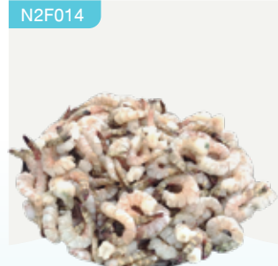
Frozen Peeled Vannamee Shrimp (40 shrimps/kg.) 300 g.