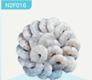
Frozen peeled White Tiger Prawn (40 prawns/kg.) 300 g.