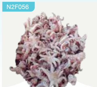
Frozen Squid Head 350 g.