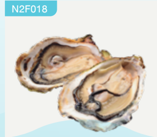
Frozen Oysters 5 Oysters