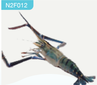
Frozen Scampi (8-10 prawns/kg.) 500 g.