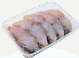
Frozen Sliced Seabass 450 g.