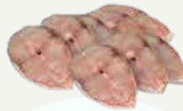
Frozen Sundried King Mackerel Steak 500 g.