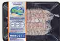
Frozen Steamed White Crayfish Meat (size 4 squid/kg.) 120 g.