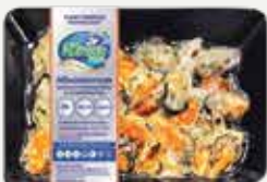
Frozen Steamed Mussel Meat 150 g.