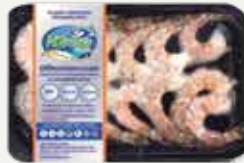
Frozen Peeled White Tiger Prawn (size 40 prawns/kg.) 300 g.