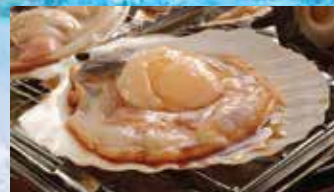
อาหารทะเลแช่แข็ง ตรา SFF