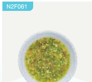
Frozen Seafood Sauce