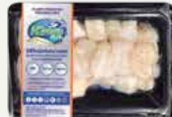
Frozen Comb Pen Shell 200 g.