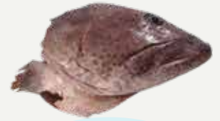
Frozen Chopped Hybrid Grouper's Head 1,000 g.