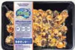
Frozen Steamed King Cockle Meat 200 g.