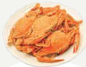
Frozen Steamed Blue crab (3-4 crabs/kg.) 800-900 g.