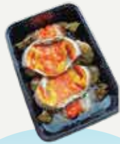
Frozen egg Blue Crab Marinated In Fish Sauce (4 crabs) 350 g.