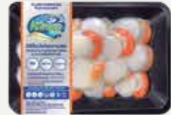
Frozen Scallop 200 g.