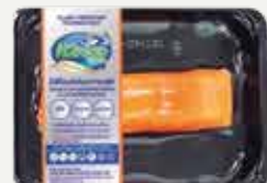
Frozen Salmon 190-300 g.