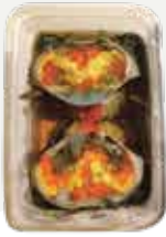
Frozen Black Egg Crab Marinated In Fish Sauce 350 g.