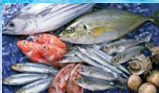
อาหารทะเลแช่แข็ง