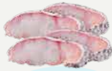
Frozen Sliced Hybrid Grouper 450 g.