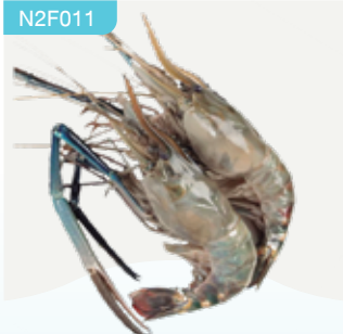
Frozen Scampi (4 scampies/kg.) 2 scampies