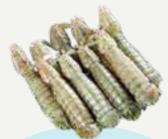
Frozen Crayfish (25 crayfish/kg.) 500 g.