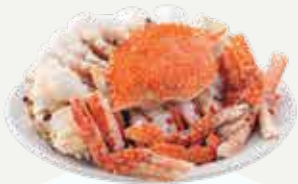
Frozen Peeled Steamed Blue Crab (5-6 crabs/kg.) 1,000 g.