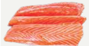
Frozen Salmon 275-500 g.