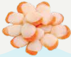
Frozen Scallop Meat (27-30 scallops/kg.) 500 g.