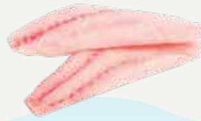
Frozen Hybrid Grouper Fillet 400 g.