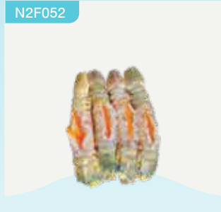
Frozen Peeled Egg Crayfish (25 crayfish/kg.) 150 g.