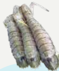
Frozen Giant Crayfish (3-4 crayfish/kg.) 500 g.