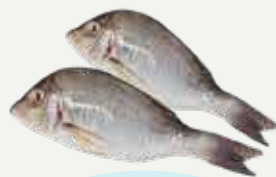
Frozen Emperor fish 500-600 g.