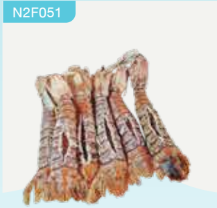
Frozen Steamed Egg Crayfish (25 crayfish/kg.) 160 g.