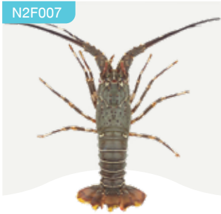
Frozen lobster 300-400 g.