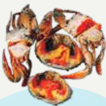
Frozen Egg Black Crab (4-5 crabs/kg.) 900-1,000 g.