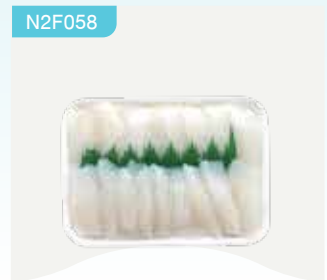
Frozen Bigfin Reef Squid Sashimi (1 squid) 100 g.