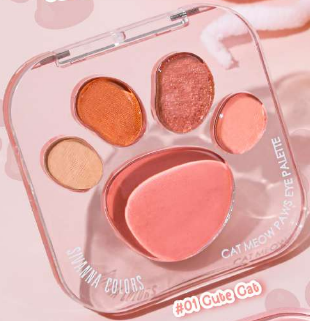
#01 Cute Cat