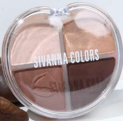
No.04 SUGAR CHESTNUT