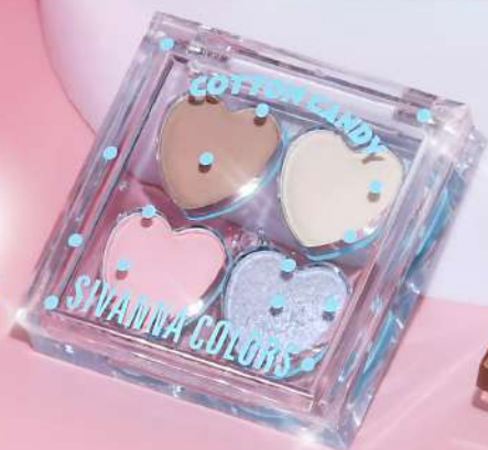
NO.03 COTTON CANDY