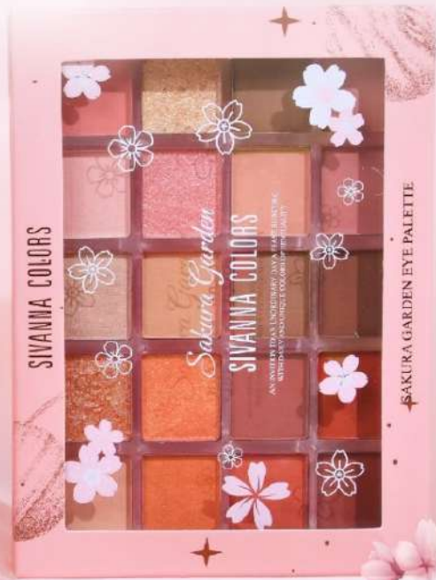
NO.01 CHERRY BLOSSOM SNOW MOON