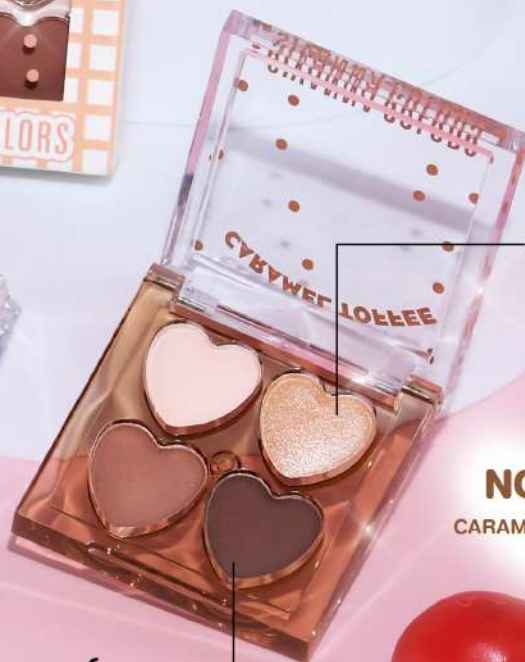
NO.04 CARMEL TOFFEE