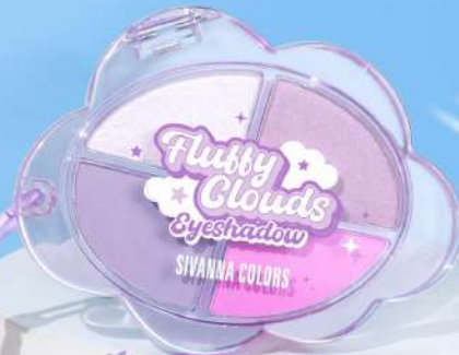
#04 Twilight Cloud