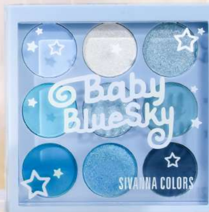
#05 BABY BLUE SKY