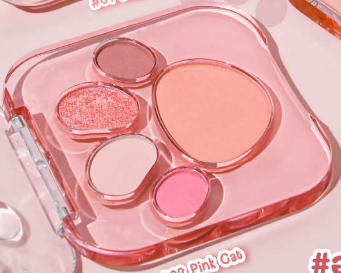
#02 Pink Cat