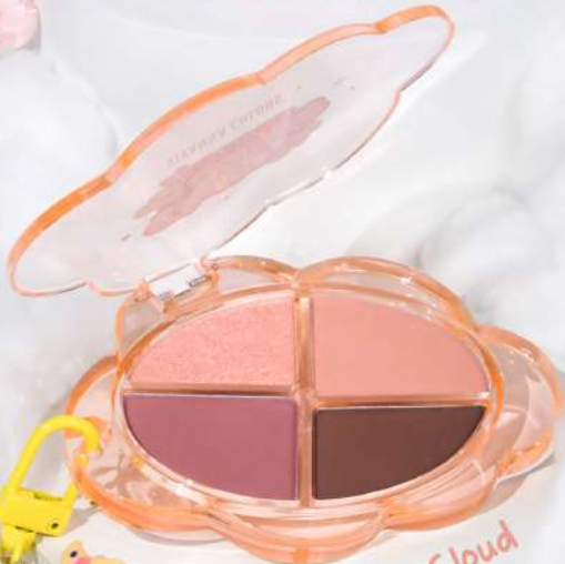
#02 Sunny Cloud