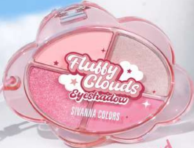
#03 Cotton Cloud