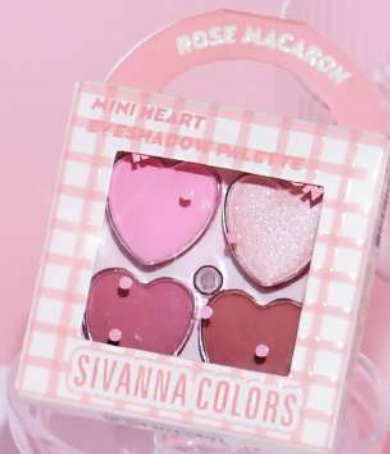
NO.01 ROSE MACARON