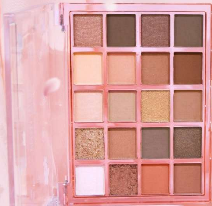
NO.02 CHERRY BLOSSOM RAIN FALLING