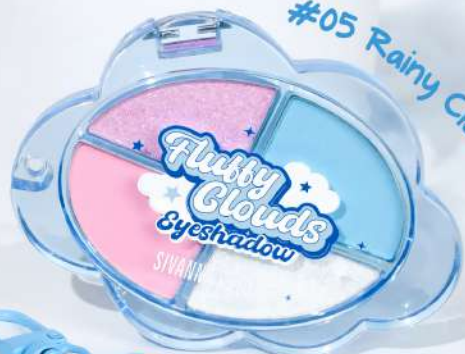
#05 Rainy Cloud