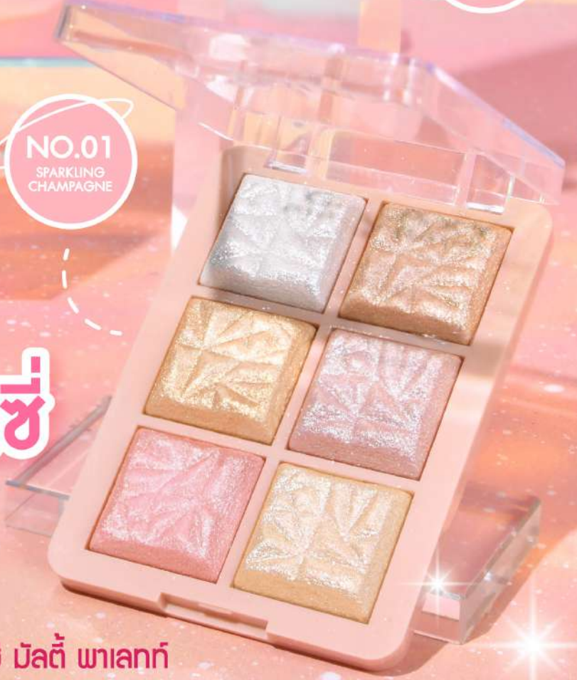
NO.01 SPARKLING CHAMPAGNE