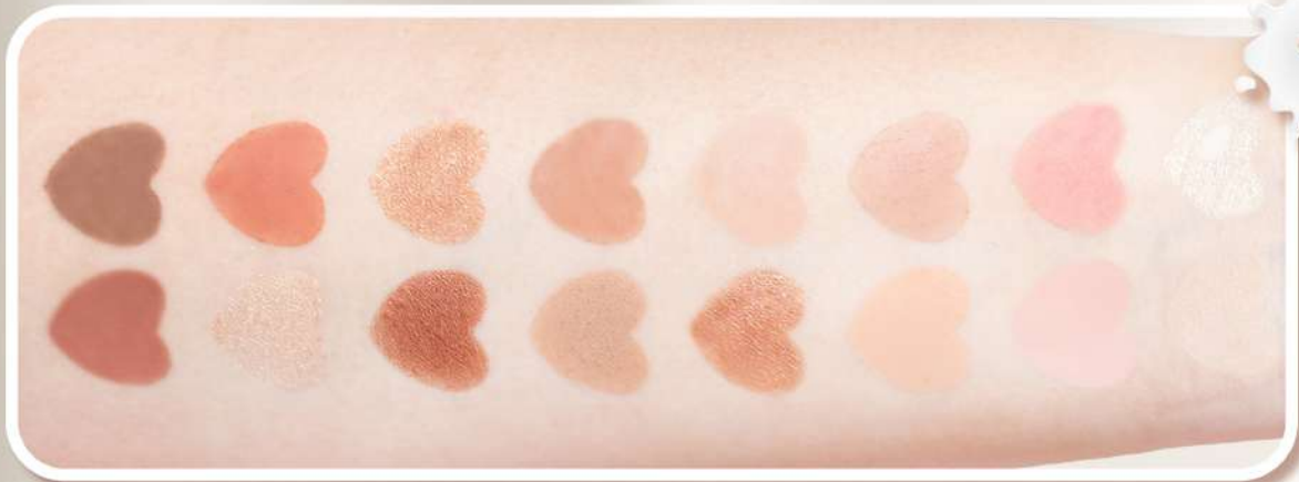
#03 OATMEAL MILK