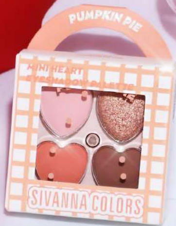
NO.02 PUMPKIN PIE