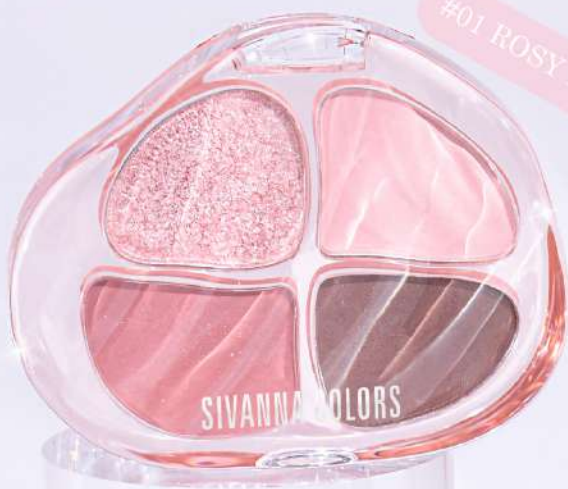
#01 ROSY DEW