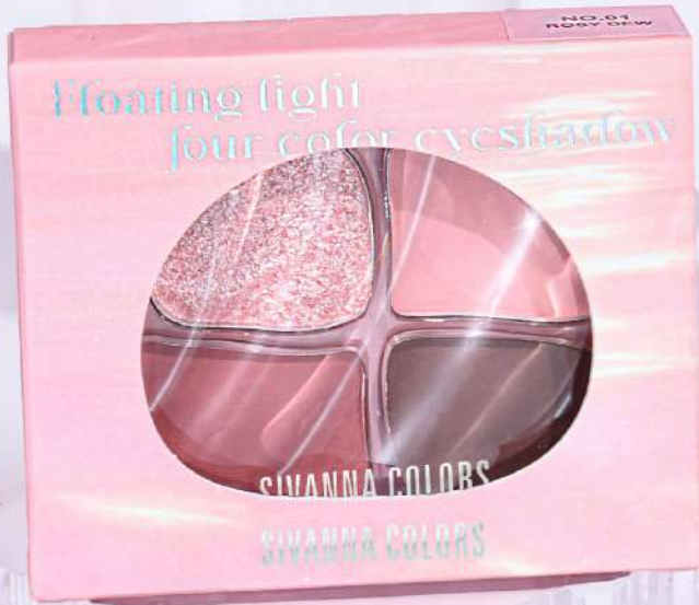
#03 BRONZER MOON