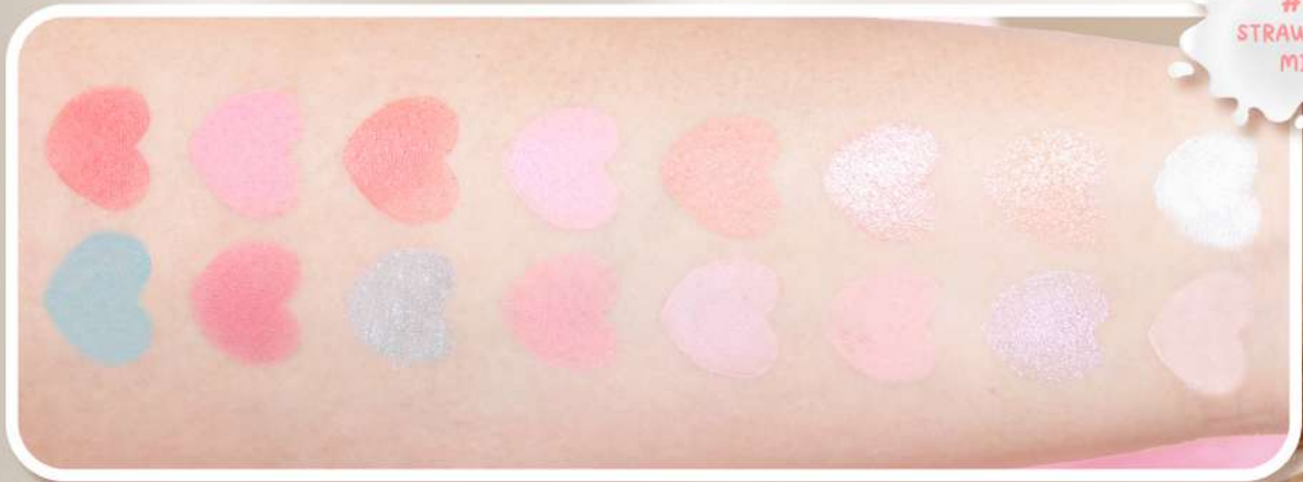
#01 STRAWBERRY MILK