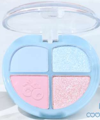
No.03 COOL BLUEBERRY