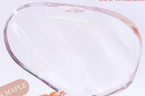
#02 BROWN MAPLE