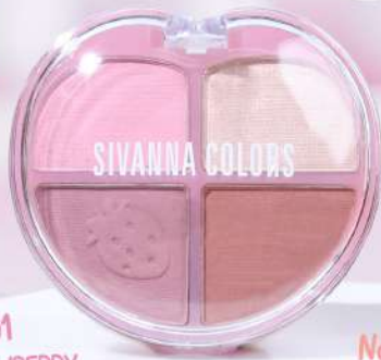
No.02 FRUITY ORANGE