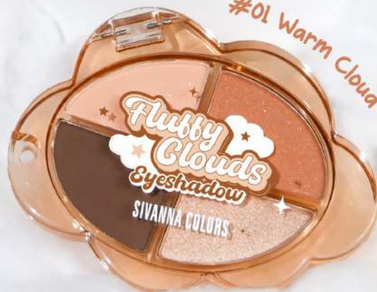
#01 Warm Cloud