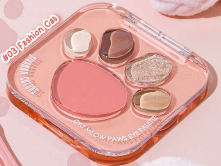
#03 Fashion Cat