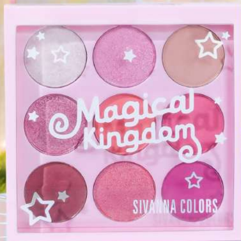
#01 MAGICAL KINGDOM