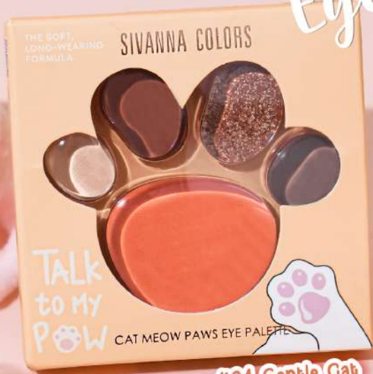
#04 Gentle Cat