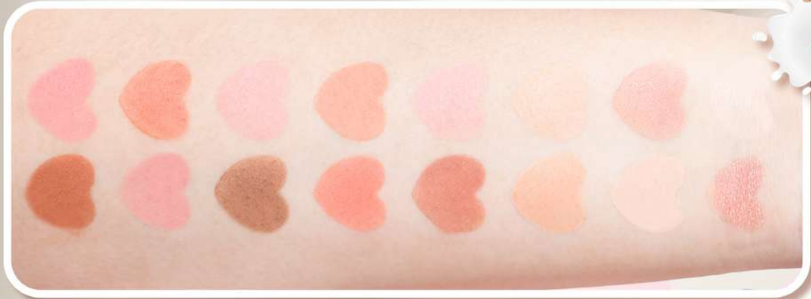
#02 ORANGE MILK