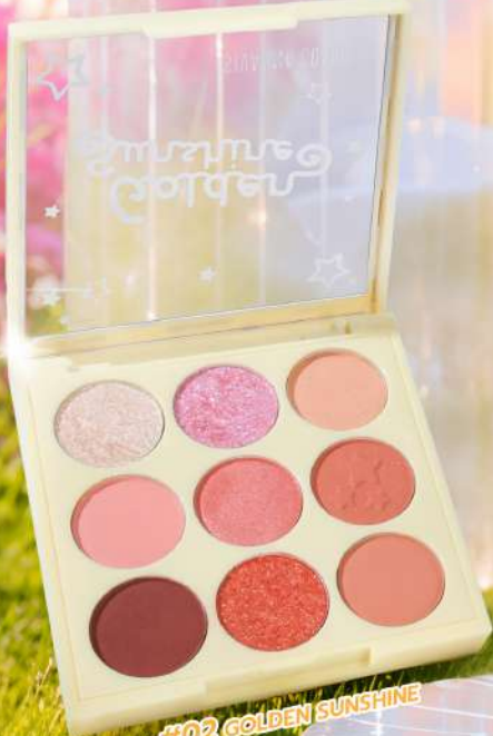
#02 GOLDEN SUNSHINE