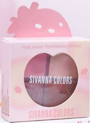
No.01 WILD STRAWBERRY