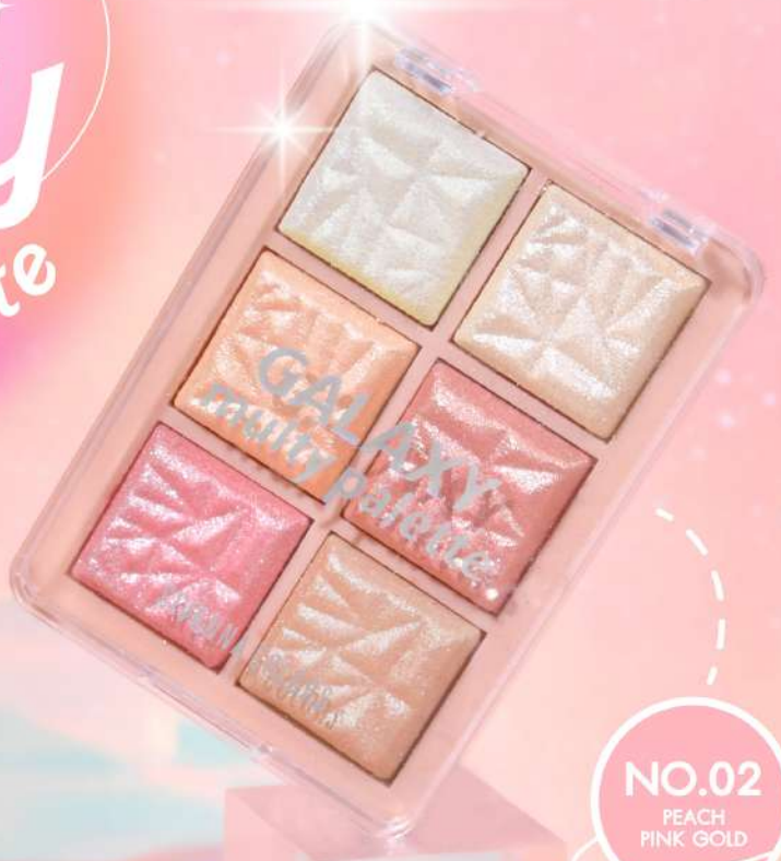
NO.02 PEACH PINK GOLD