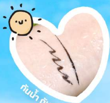
กันน้ำ กันเหงื่อ