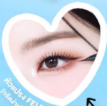
หัวแปรง FELT TIP (กรีดง่ายขีดขอบตา)