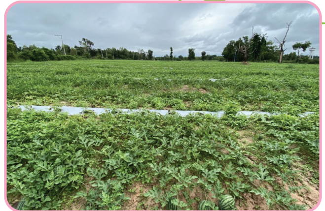
ต้นแตงโมระยะเติบโต มีลำต้นยาวใหญ่ มีใบมาก ใบใหญ่ ใบเขียวตลอด ไม่เป็นโรค ไม่ต้องใช้สารเคมีกำจัดเชื้อโรค