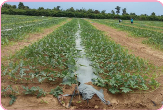
ต้นแตงโมงอกใหม่มีลำต้นอวบสมบูรณ์ ใบใหญ่ ใบหนา มีสีเขียวเข้ม