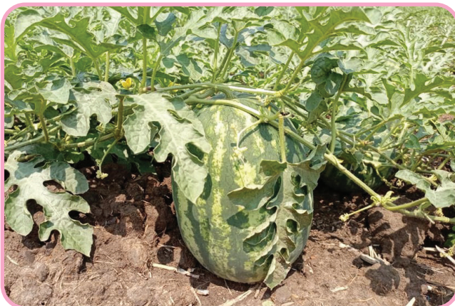
ต้นแตงโมสมบูรณ์ มีการออกดอกและติดลูกมาก ผลแตงโมมีขนาดใหญ่ ต้นแม่ใบยังเขียวและไม่เป็นโรค