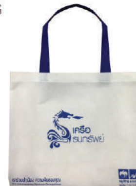
กระเป๋าผ้าสัณนิบาต รมาคาร ไทย-แอ็กซ่า ประกันชีวิต