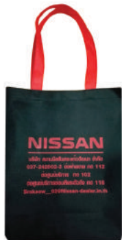
กระเป๋าผ้า สับนซอนด์ Nissan