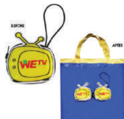
ถุงผ้าพับเก็บได้ WETV