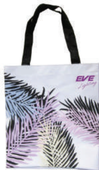
Uv Magic Bag อีฟ ไลท์ติ้ง