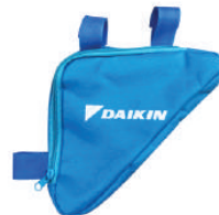
กระเป๋าติดรถจักรยาน Daikin