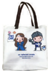
กระเป๋าผ้าแคววาส กรุงเทพฯ-เอกซ่า ประกันชีวิต