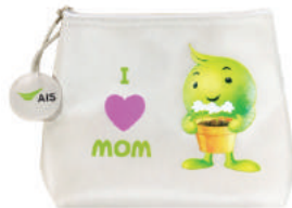
กระเป๋าเนกประสงค์ AIS