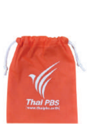
ถุงผ้าสับนซอนด์ THAI PBS