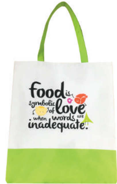
กระเป๋าผ้า 600d เททาโกร