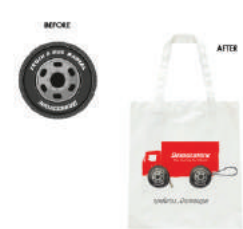
ถุงผ้าพับเก็บได้ Bridgestone