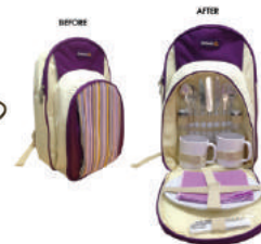
ชุดกระเป๋าเดินทาง รมาคารไทยพาณิชย์