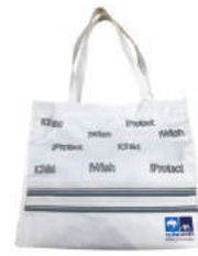
UV Magic Bag กรุงเทพฯ-เอกซ่า ประกันชีวิต