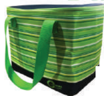
กระเป๋าเก็บรองเท้า - เป็น Oshopping