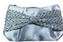
กระเป๋าเครื่องสำอาง วูฒิ-คักดี คลสิมิก