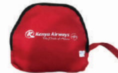
กระเป๋าเดินทางพับเก็บได้ Kenya Airways