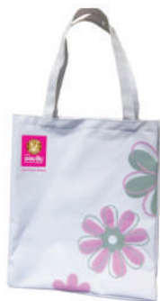
Uv Magic Bag รมาคาร ออมสิน