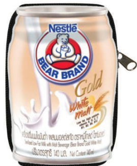
ถุงผ้าพับเก็บได้ นมตราหมี