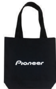
กระเป๋าผ้า สับนซอนด์ Pioneer