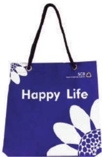
UV Magic Bag โททพาเบียงซ์ ประกันชีวิต