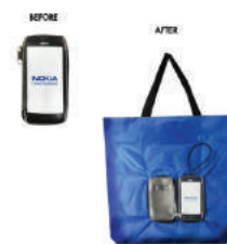
ถุงผ้าพับเก็บได้ โนเกีย