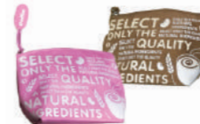
UV magic Bag Ovaltine