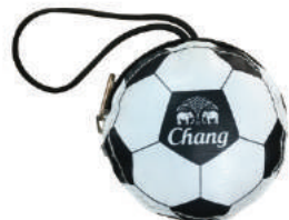
ถุงผ้าพับเก็บได้ Beer Chang