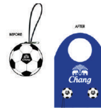
ถุงผ้าพับเก็บได้ ช้าง