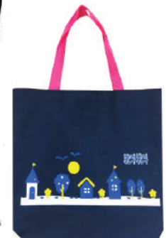
ถุงผ้า 600d Kirei Kirei