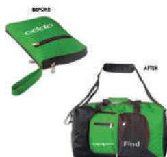
กระเป๋าเดินทางพับเก็บได้ OPPO