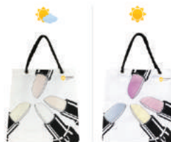
กระเป๋า UV รมาคารกรุงศรี