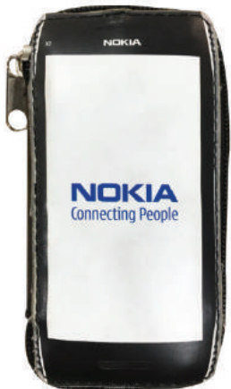
กระเป๋าพับเก็บได้ NOKIA