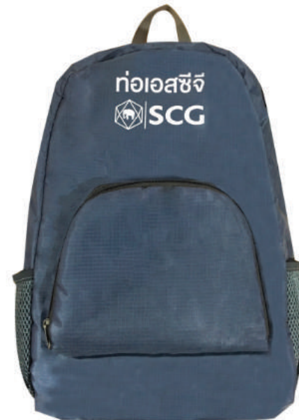
เป้พับเก็บได้ SCG