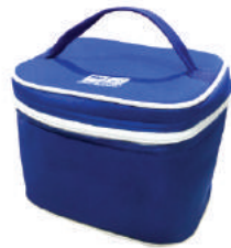
กระเป๋าเก็บความร้อน-เย็น กรุงเทพฯ-เอกซ่า ประกันชีวิต