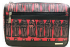
กระเป๋าอเนกประสงค์ COKE