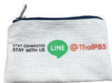
กระเป๋าใส่เหรียญ Thai PBS