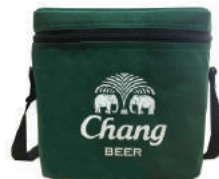
กระเป๋าเก็บความเย็น Beer Chang