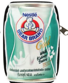
ถุงผ้าพับเก็บได้ นมตราหมี