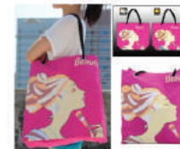
UV Magic bag มิสกีน