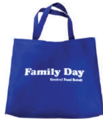
กระเป๋าผ้า 600 D Central Food Retail