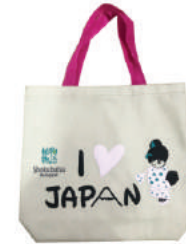
ถุงผ้า 600d Shokubutsu