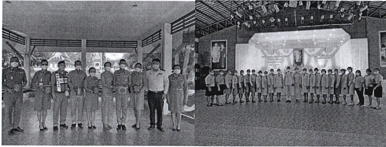
ทำบุญตักบาตร