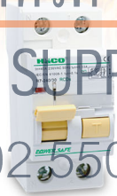
อุปกรณ์ป้องกันไฟรั่ว, ไฟดูด Residual Current Devices (RCDs)

ผ่านการทดสอบโดยศูนย์เชี่ยวชาญทางด้านเทคโนโลยีไฟฟ้าของ คณะวิศวกรรมศาสตร์ จุฬาลงกรณ์มหาวิทยาลัย