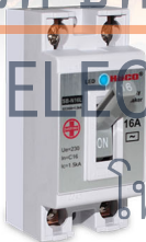
เบรกเกอร์กันดูด Earth Leakage Breaker 2P 1E

เป็นเบรกเกอร์ป้องกันไฟดูดที่ติดตั้งเพื่อทำหน้าที่ตัดวงจรไฟฟ้าเมื่อเกิดเหตุไฟรั่ว ไฟดูดจากเครื่องใช้ไฟฟ้าเพื่อป้องกันความสูญเสียต่อชีวิตและทรัพย์สินเหมือนกับเครื่องใช้ไฟฟ้าเช่น บิ๊มบ๊ว, อ่างอาบน้ำ, ตู้แช่เย็น เป็นต้น