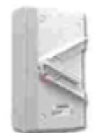
Weather Proof Isolator (IP66)