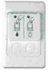
2036VC2 2036VC3N 2036VC4