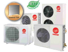
Terminal Block ในคอมเดนซึ่งเป็นชนิดไม่ลามไฟ และผ่านมาตรฐาน IEC60335-2-40