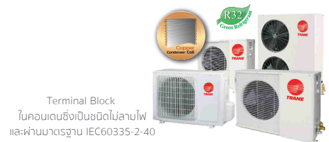
Terminal Block ในคอนเดนซิ่งเป็นชนิดไม่ลามไฟ และผ่านมาตรฐาน IEC60335-2-40

พร้อมด้วย Condensing Unit ที่มีมาตรฐานการทำงานสูง รับประกันคุณภาพคอมเพรสเซอร์ นานถึง 7 ปี