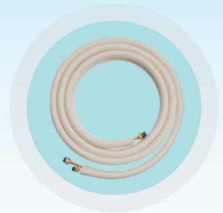
มีท่อร้อยสายสำหรับยาว 4 เมตรมาพร้อมกับเครื่อง