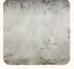
เครื่องปรับอากาศที่ไม่เคลือบสาร