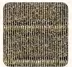
เครื่องปรับอากาศที่ไม่เคลือบสาร