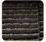
เครื่องปรับอากาศที่ไม่เคลือบสาร