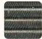
เครื่องปรับอากาศที่เคลือบสาร

1 ชุดแลกเปลี่ยนความร้อน (Heat Exchanger)