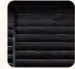
เครื่องปรับอากาศที่เคลือบสาร