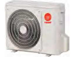
Terminal Block ในคอนเดนซิ่งเป็นชนิดไม่ลามไฟ และผ่านมาตรฐาน IEC60335-2-40