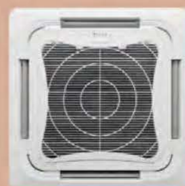
หน้าากแบบธรรมดา (BC50FS)