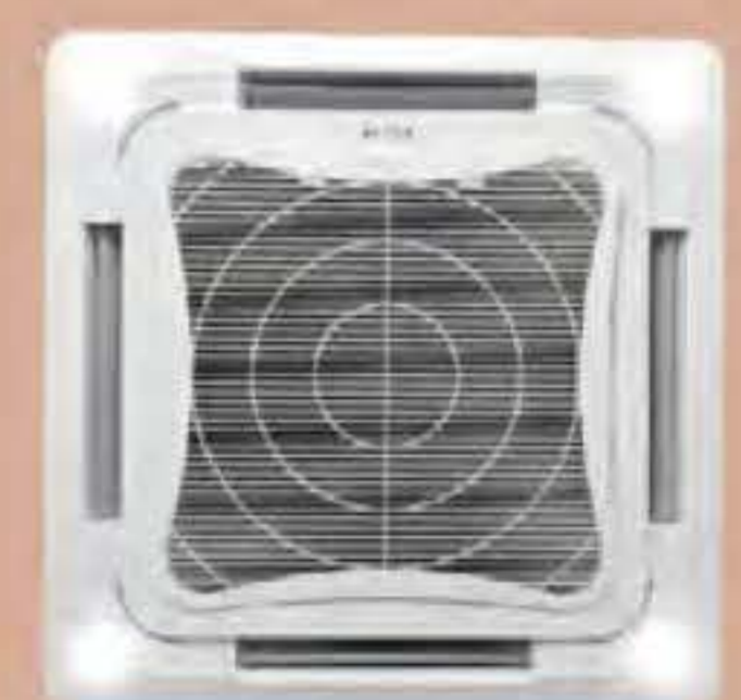
หน้าากพร้อมไฟ LED อุปกรณ์เสริม (BC50FLS)