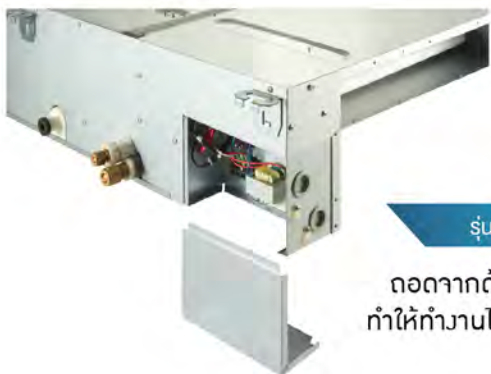
รุ่นใหม่ ถอดจากด้านล่างได้ ทำให้ทำงานได้สะดวกขึ้น