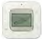
BRC2E61 (รีโมทมีสาย)