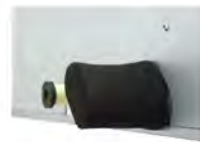
ฝาครอบท่อก๊าซและท่อของเหลว (บรรจุในกล่องพร้อมผลิตภัณฑ์ทั้ง 2 ด้าน)

สามารถเลือกติดตั้งได้ทั้งซ้ายและขวา เมื่อเลือกใช้งานด้านใด ด้านหนึ่งให้ดึงฝาครอบท่อก๊าซ และท่อของเหลวที่ใช้งานด้านนั้นออก จากนั้นให้ถอดแผ่นกันรั่วก่อนทำการเชื่อมต่อ