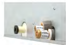
แผ่นกันรั่ว (เพิ่มมากับท่อก๊าซและท่อของเหลวทั้ง 4 จุด)

เหมาะสำหรับโรงแรม, คอนโดมิเนียม เลือกเชื่อมต่อได้จากทั้งฝั่งซ้าย และขวา ดีไซน์ที่เน้นความบางและความเงียบ