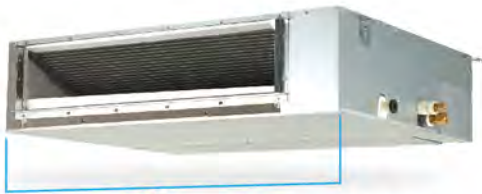
70 cm* *รุ่น FDBF13/18DV2S

ออกแบบคอยล์เย็นให้มีความกว้างที่พอดีกับโถงทางเดินในห้อง