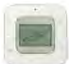
BRC2E61 (รีโมทสีขาว)