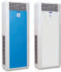
▲ 40QBY Series

The latest innovation from the world leader in air conditioning, Carrier, introduces the all-new floor standing split air conditioning system. The 40QBY millennium design, inside and out, will provide you with cool comfort via a variety of control functions.