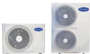
38RLY(012-040) Condensing Unit

มก. 2134-2553 : This standard cover room air conditioner of split type, having net total cooling effect not exceeding 12,000 watt.