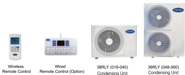
Wireless Remote Control

หมายเหตุ, 2134-2553 : This standard cover room air conditioner of split type, having net total cooling effect not exceeding 12,000 watt.