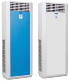
▲ 40QBY Series

The latest innovation from the world leader in air conditioning, Carrier, introduces the all-new floor standing split air conditioning system. The 40QBY millennium design, inside and out, will provide you with cool comfort via a variety of control functions.