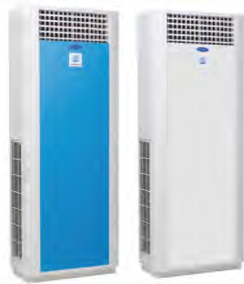
▲ 40QBY Series

The latest innovation from the world leader in air conditioning, Carrier, introduces the all-new floor standing split air conditioning system. The 40QBY millennium design, inside and out, will provide you with cool comfort via a variety of control functions.