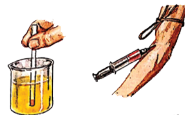
Testing of blood and urine samples will help diagnose what is wrong.