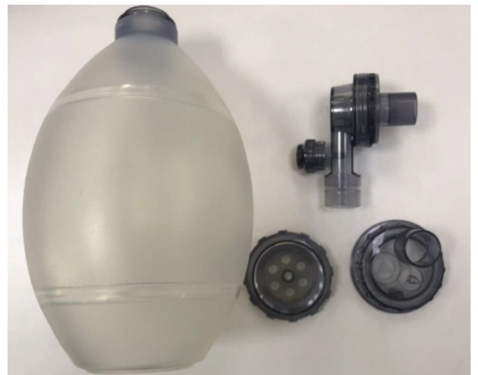
4. ใส่ชิ้นส่วนทั้งหมดลงในภาชนะเพื่อฆ่าเชื้อ

หมายเหตุ : 1. ถุงเก็บน้ำ ท่อออกซิเจน ที่เปิดปาก และทางเดินหายใจ เป็นแบบใช้แล้วทิ้ง