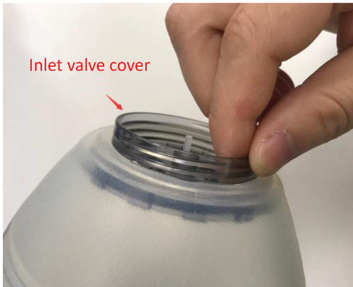
3. ถอดวาล์วด้านล่างออก