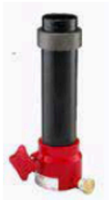
Style 656 The pipe