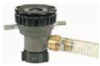
Style 888 Self-Educting Nozzle (750 GPM)