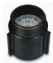
Style 119 Stream Shaper