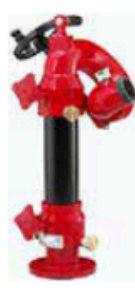
Style 656 shown with Style 622 monitor liftoff