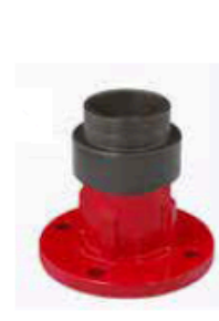
Style 190 Direct Mount Flange