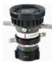
Style 847 Monitor Nozzle