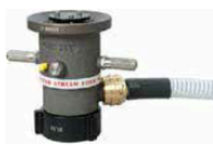
Style 887 Self-Educting Nozzle (500 GPM)