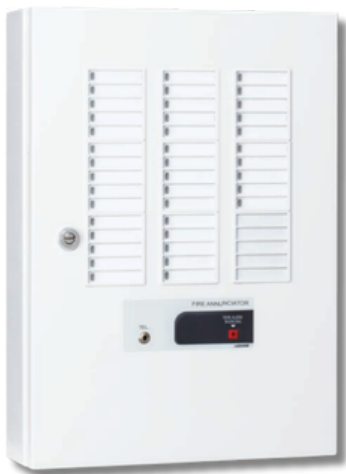
FIPN103-E2-40L, 50L, and 60L ① ZONE LED AND NAME PLATE

“NOHMI” Model : FIPN103-E2-40L Conventional Fire Alarm Annunciator