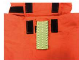
DRD (Drag Rescue Device) ด้านหลังทำด้วยเคฟล่า