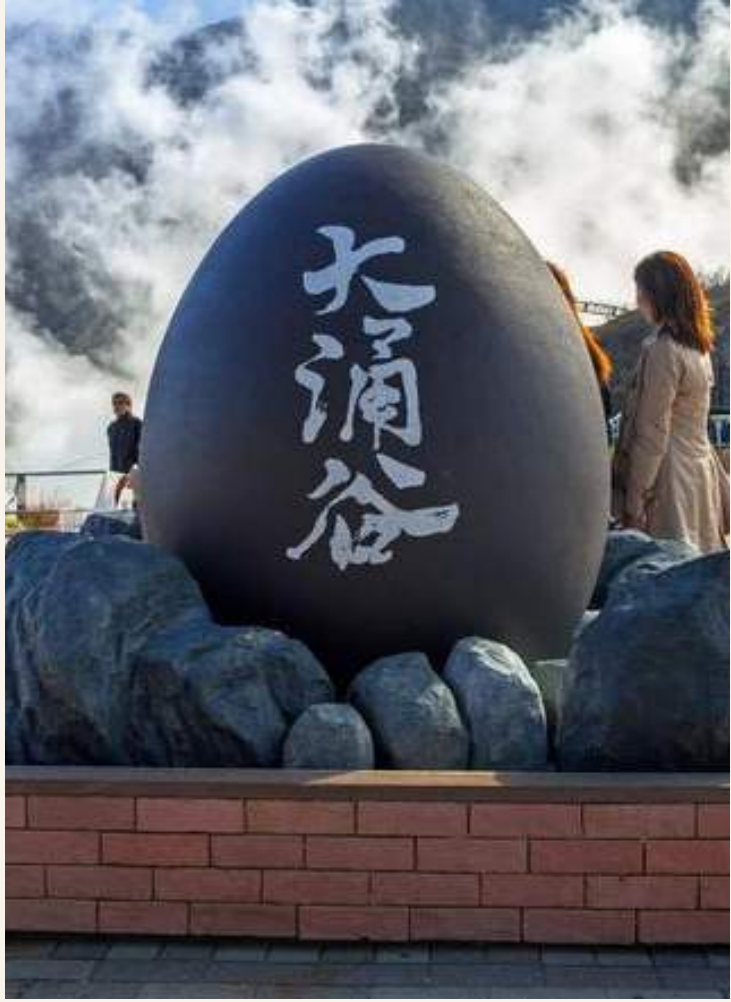
โอวาคุดานิ

วันที่ 2 : โอวาคุดานิ - ทะเลสาบอาชิ - มิซึมะ สกายวอล์ค - โทเทมบะเอาก์เล็ท