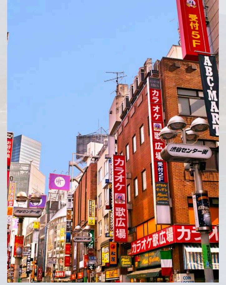
ย่านชิบูย่า