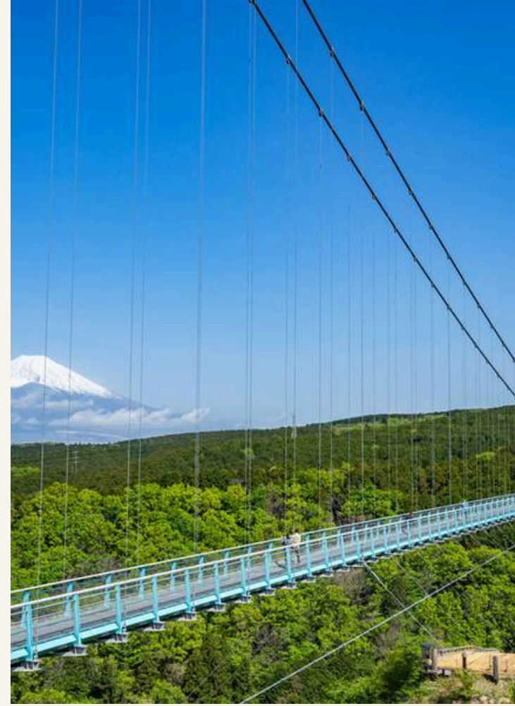
มิซึมะ สกายวอล์ค