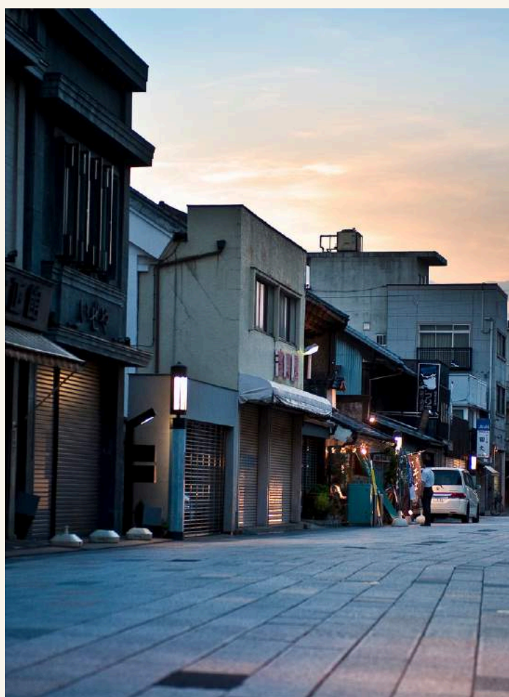
เมืองเก่าคาวาโกเอะ

วันที่ 1 : สนามบินนาริตะ - เมืองเก่าคาวาโกเอะ - คาวากุจิโกะ