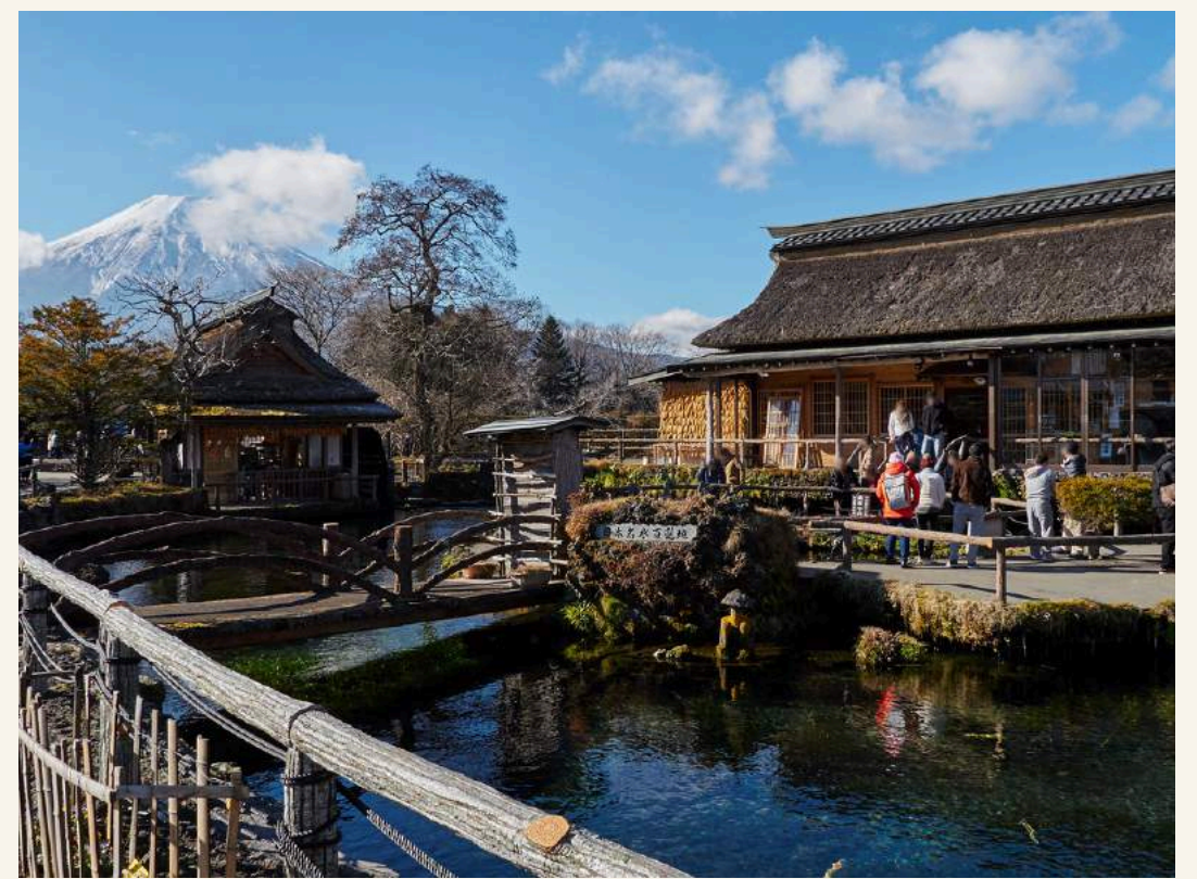
หมู่บ้านโอชิโนะฮักไก