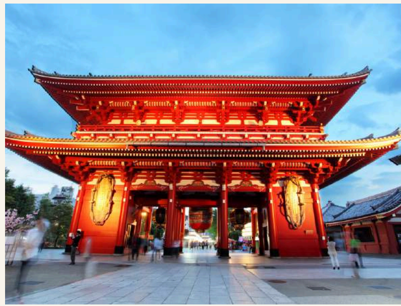
ถนนนาริตะซัง