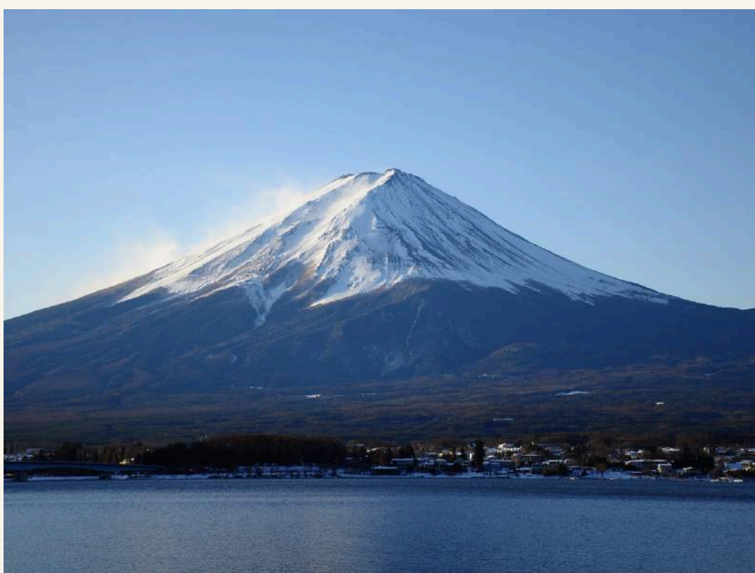
ทะเลสาบคาวากุจิโกะ

วันที่ 3 : ชมวิวรอบๆทะเลสาบคาวากุจิโกะ - หมู่บ้านโอชิโนะฮักไก - โตเกียว - ย่านชินจูกุ