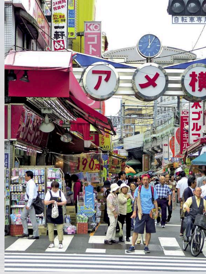
ย่านอุเอโนะ