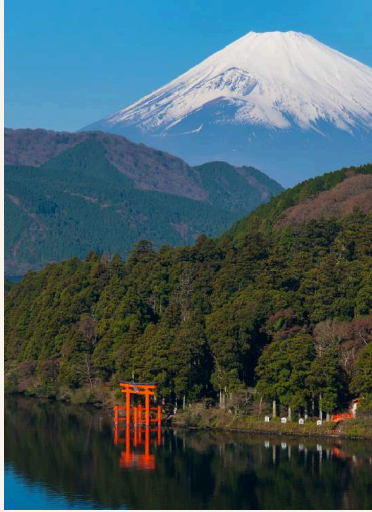
ทะเลสาบอาชิ