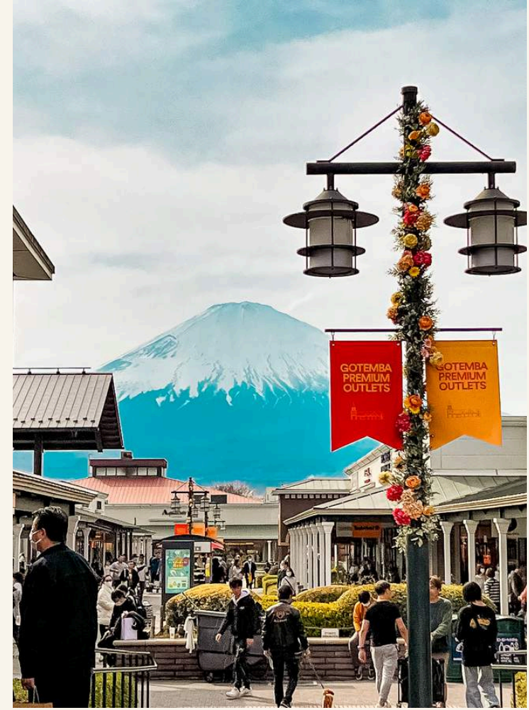
โทเทมบะเอาก์เล็ท

วันที่ 3 : ชมวิวรอบๆทะเลสาบคาวากุจิโกะ - หมู่บ้านโอชิโนะฮักไก - โตเกียว - ย่านชินจูกุ