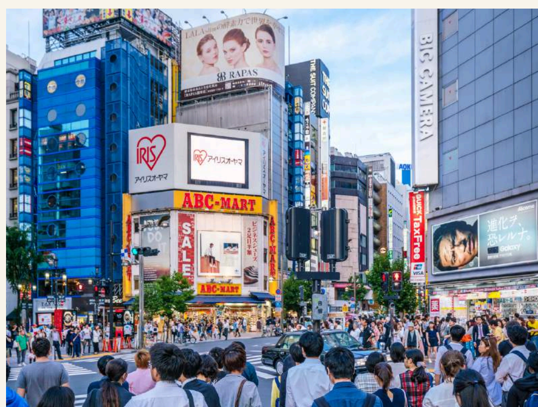
ย่านชินจูกุ