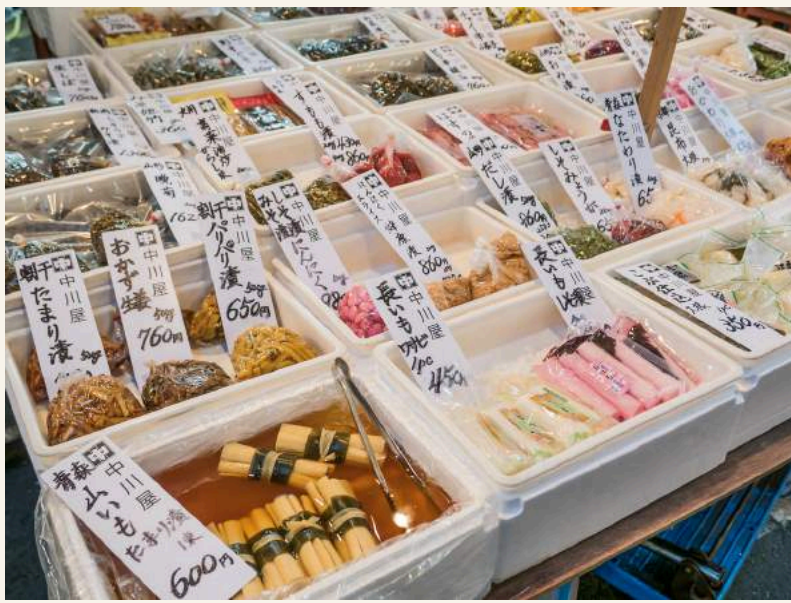
ตลาดปลาสึกิจิ