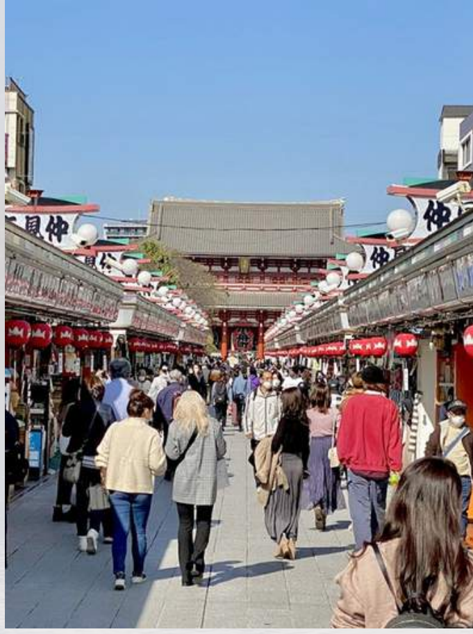
ถนนนากามิเสะ